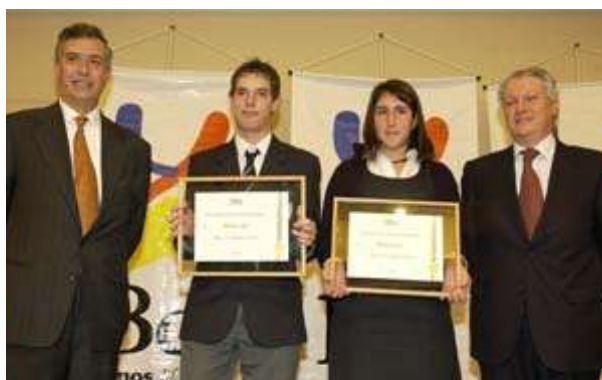
Becas a hijos de Colaboradores de Bci