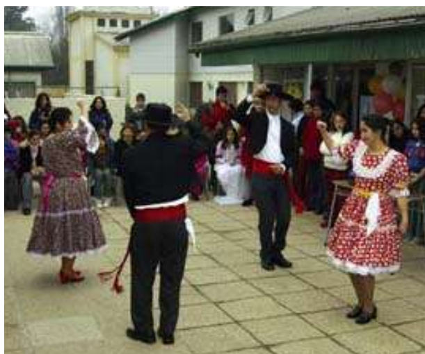
Día del Niño