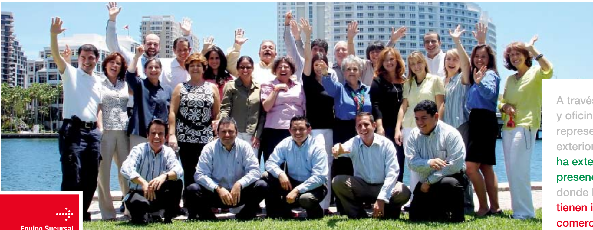
Equipo Sucursal Bci Miami

A través de sucursales y oficinas de representación en el exterior, la Corporación ha extendido su presencia a los lugares donde los clientes tienen intereses comerciales