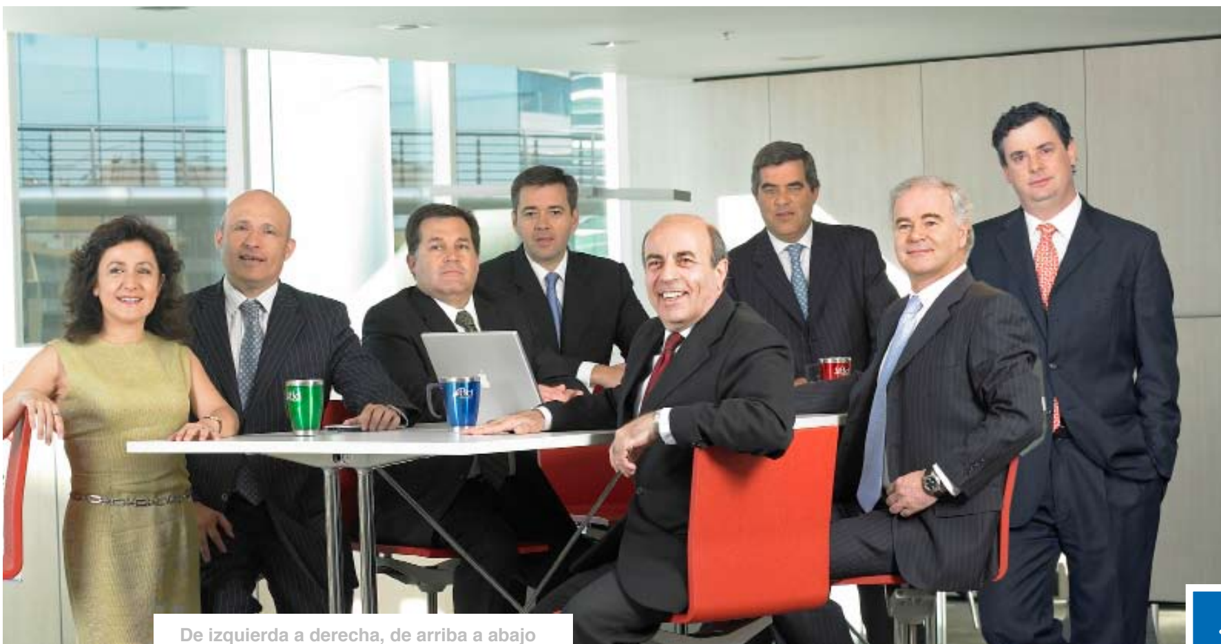
De izquierda a derecha, de arriba a abajo